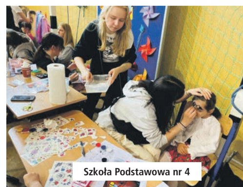
Szkoła Podstawowa nr 4