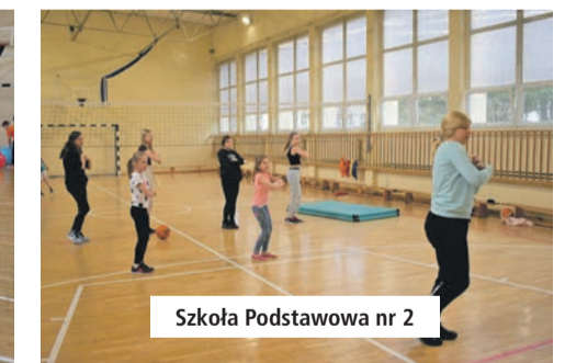
Szkoła Podstawowa nr 2