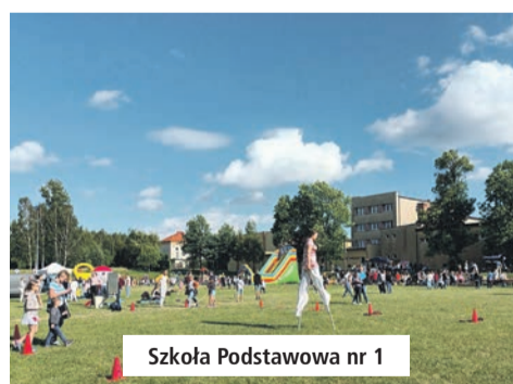
Szkoła Podstawowa nr 1

Festyny w ramach alternatywnych form spędzania wolnego czasu zostały zorganizowane także na terenie lędzińskich szkół podstawowych. Oprócz kolorowych występów, nie zabrakło w nich animacji dla dzieci, kolorowych stoisk czy stoisk gastronomicznych z przeróżnymi potrawami. Wszystkim szkołom i przedszkolom gratulujemy zorganizowania tak udanych imprez.