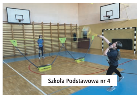
Szkoła Podstawowa nr 4