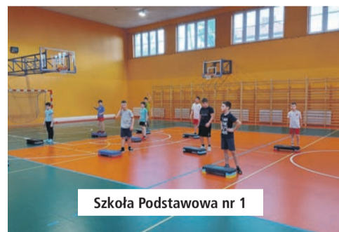
Szkoła Podstawowa nr 1