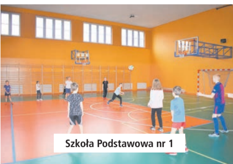
Szkoła Podstawowa nr 1