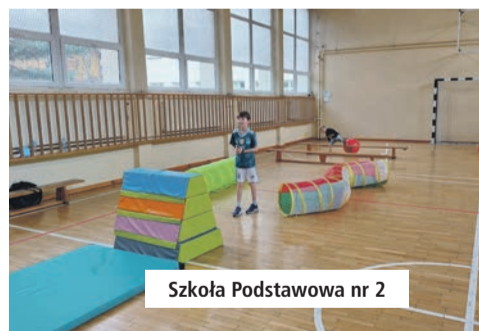
Szkoła Podstawowa nr 2