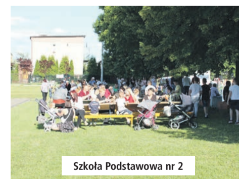
Szkoła Podstawowa nr 2