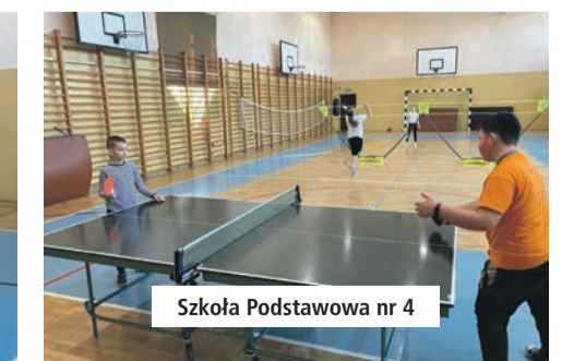
Szkoła Podstawowa nr 4