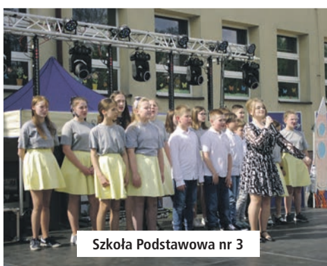
Szkoła Podstawowa nr 3