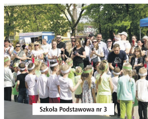
Szkoła Podstawowa nr 3