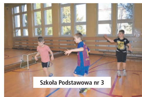
Szkoła Podstawowa nr 3