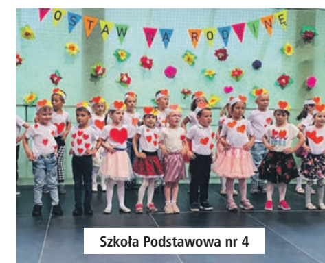
Szkoła Podstawowa nr 4