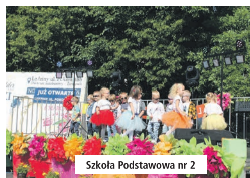
Szkoła Podstawowa nr 2