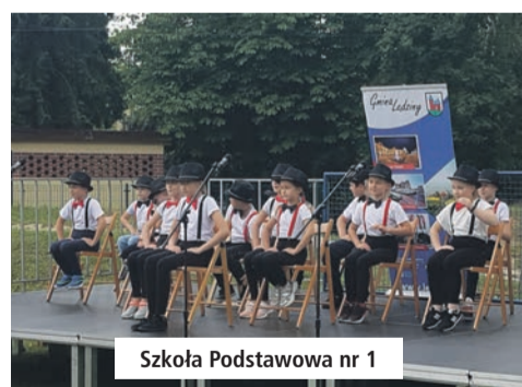
Szkoła Podstawowa nr 1