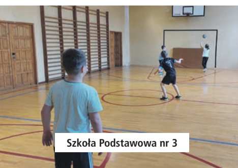
Szkoła Podstawowa nr 3