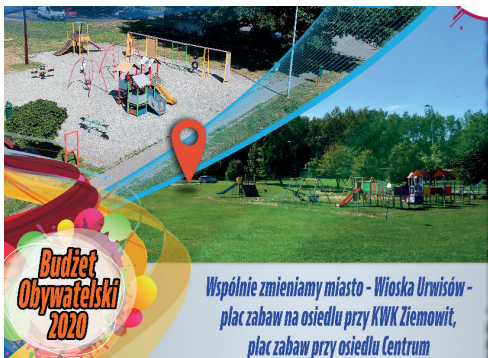
Budżet Obywatelski 2020 Wspólnie zmieniamy miasto - Wioska Urwisów - plac zabaw na osiedlu przy KWK Ziemowit, plac zabaw przy osiedlu Centrum