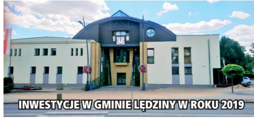
INWESTYCJE W GMINIE ŁĘDZINY W ROKU 2019