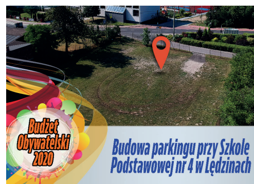
Budżet Obywatelski 2020 Budowa parkingu przy Szkole Podstawowej nr 4 w Łędzinach