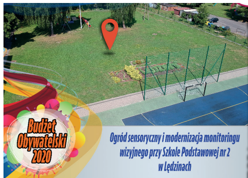
Budżet Obywatelski 2020 Ogród sensoryczny i modernizacja monitoringu wizyjnego przy Szkole Podstawowej nr 2 w Łędzinach