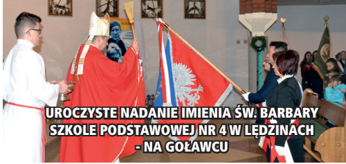
UROCZYSTE NADANIE IMIENIA ŚW. BARBARY SZKOLE PODSTAWOWEJ NR 4 W ŁĘDZINACH - NA GOŁAWCU