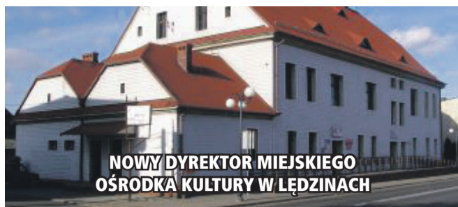
NOWY DYREKTOR MIEJSKIEGO OŚRODKA KULTURY W ŁĘDZINACH