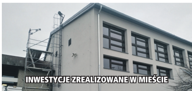
INWESTYCJE ZREALIZOWANE W MIEŚCIE