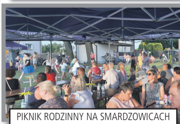
PIKNIK RODZINNY NA SMARDZOWICACH 15.08.2021 R.