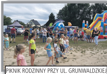
PIKNIK RODZINNY PRZY UL. GRUNWALDZKIEJ 08.08.2021 R.