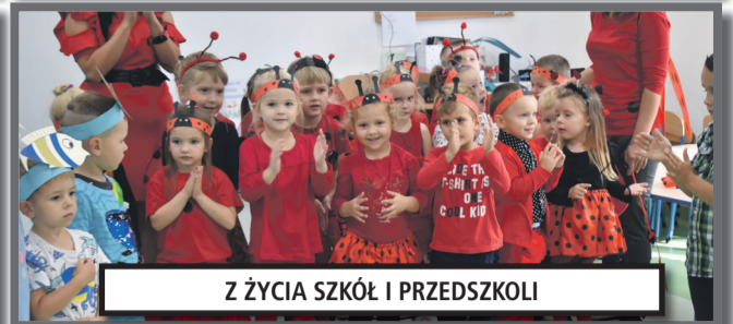
Z ŻYCIA SZKÓŁ I PRZEDSZKOLI