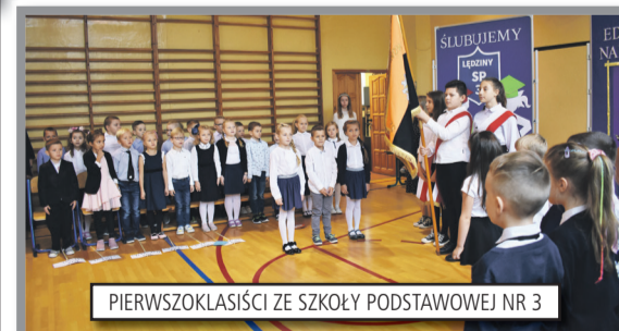
PIERWSZOKLASIŚCI ZE SZKOŁY PODSTAWOWEJ NR 3

14 października 2021 roku to dzień w którym nie tylko nauczyciele mają swoje święto. W tym dniu świętowali również uczniowie klas pierwszych. Uroczystość pasowania odbyła w łędzińskich szkołach podstawowych: SP2, SP3, SP4.