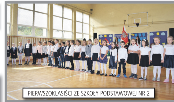
PIERWSZOKLASIŚCI ZE SZKOŁY PODSTAWOWEJ NR 2

14 października 2021 roku to dzień w którym nie tylko nauczyciele mają swoje święto. W tym dniu świętowali również uczniowie klas pierwszych. Uroczystość pasowania odbyła w łędzińskich szkołach podstawowych: SP2, SP3, SP4.