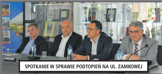
SPOTKANIE W SPRAWIE PODTOPIEŃ NA UL. ZAMKOWEJ