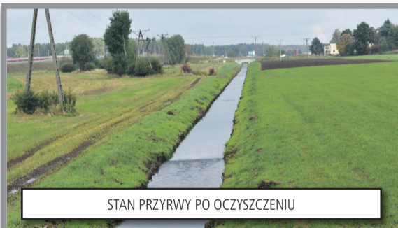
STAN PRZYRWY PO OCZYSZCZENIU