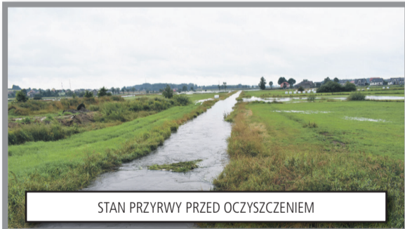
STAN PRZYRWY PRZED OCZYSZCZENIEM