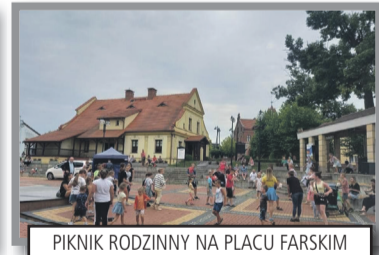
PIKNIK RODZINNY NA PLACU FARSKIM 25.07.2021 R.