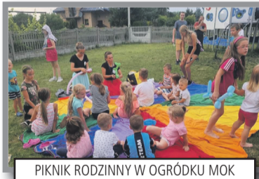
PIKNIK RODZINNY W OGRÓDKU MOK 18.07.2021 R.

Dzieciom dziękujemy za świetną zabawę, a rodzicom za zaufanie. Do zobaczenia za rok!