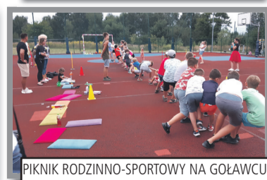
PIKNIK RODZINNO-SPORTOWY NA GOŁAWCU 22.08.2021 R.