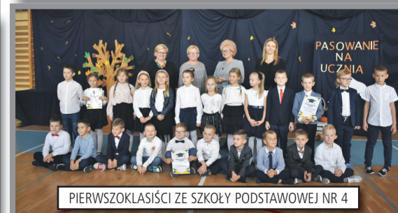
PIERWSZOKLASIŚCI ZE SZKOŁY PODSTAWOWEJ NR 4