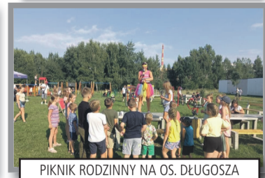
PIKNIK RODZINNY NA OS. DŁUGOSZA 14.08.2021 R.