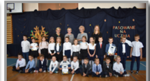
SZKOŁA PODSTAWOWA NR 4