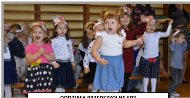
ODDZIAŁY PRZEDSZKOLNE SP3