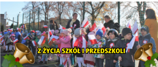
Z ŻYCIA SZKÓŁ I PRZEDSZKOLI