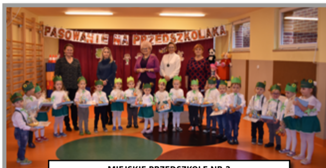
MIEJSKIE PRZEDSZKOLE NR 2