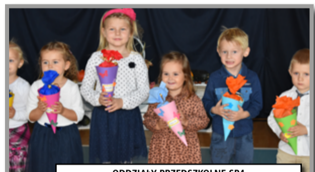
ODDZIAŁY PRZEDSZKOLNE SP4