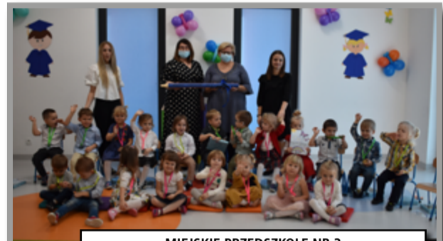
MIEJSKIE PRZEDSZKOLE NR 3