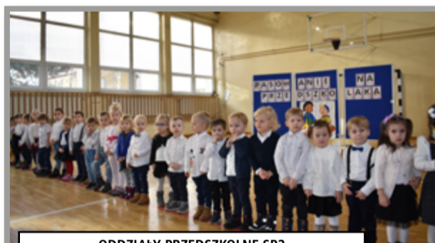
ODDZIAŁY PRZEDSZKOLNE SP2