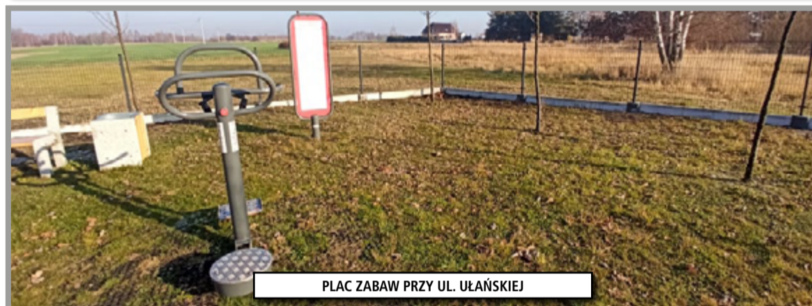
PLAC ZABAW PRZY UL. UŁAŃSKIEJ

Okręg nr 3 - Hołdunów Projekt nr 9 pod nazwą „Bezpieczne Dziecko Bezpieczne Centrum Integracji i Kultury (ul. Hołdunowska i ul. Ułańska)”