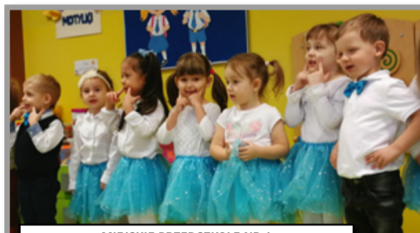
MIEJSKIE PRZEDSZKOLE NR 1