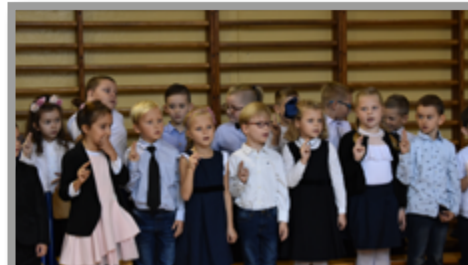
SZKOŁA PODSTAWOWA NR 3