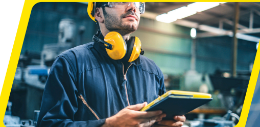
kursy IT i inne