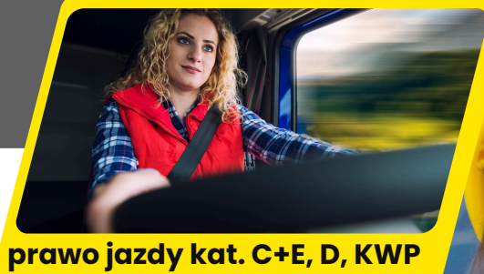
prawo jazdy kat. C+E, D, KWP