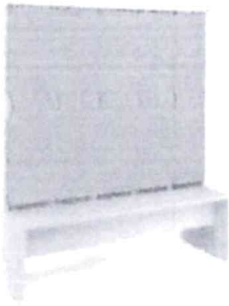
il. 1. Poglądowe zdjęcie 5 szafek

2 x 25 szafek złączonych tyłami, ustawionych w trzech rzędach, co daje łącznie 150 szafek.