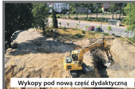
Wykopy pod nową część dydaktyczną