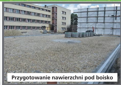
Przygotowanie nawierzchni pod boisko