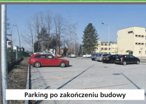
Parking po zakończeniu budowy