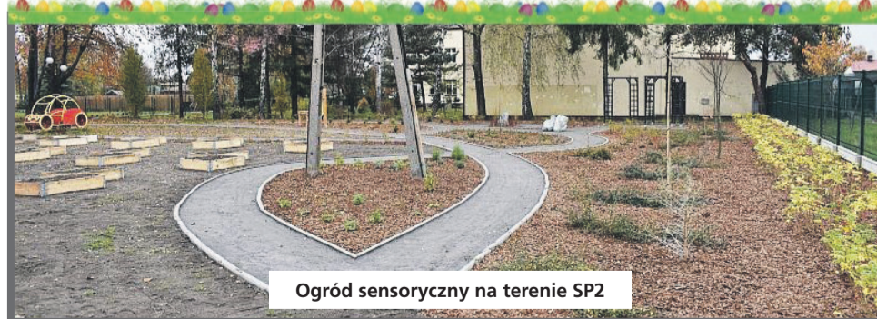
Ogród sensoryczny na terenie SP2

Przypomnijmy, że zadanie: „Czym skorupka za młodu... - dzieci najlepszą inwestycją w przyszłość” Miasteczko ruchu drogowego oraz gry podwórkowe i korytarzowe” powstało w ramach Budżetu Obywatelskiego w 2018 roku. Gmina wykonała inwestycję na terenie szkoły za kwotę 99 766,00 zł.