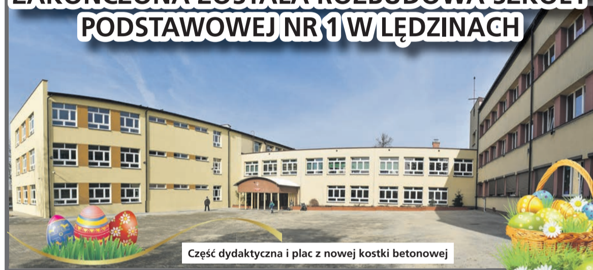
Część dydaktyczna i plac z nowej kostki betonowej

W grudniu 2020 r. zakończyła się rozbudowa Szkoły Podstawowej nr 1 przy ul. Paderewskiego w Lędzinach. Inwestycja kosztowała ponad 10 mln zł. Gmina zrealizowała ją w latach 2019-2020 ze środków budżetu miasta, a także z otrzymanego dofinansowania z: