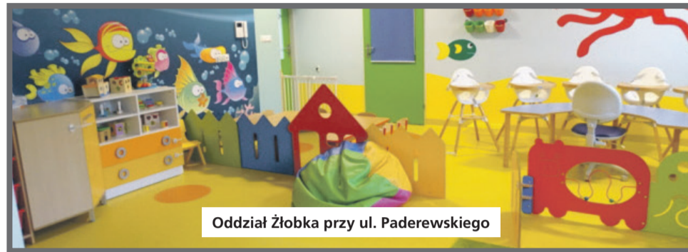
Oddział Żłobka przy ul. Paderewskiego

Przypomnijmy, że w 2015 r. powstały dwa oddziały pierwszego Miejskiego Żłobka w Łędzinach w budynku Szkoły Podstawowej nr 1. Wcześniej w pomieszczeniach obecnego żłobka mieściły się oddziały przedszkolne Przedszkola nr 1. Całkowity koszt budowy żłobka zamknął się w 800 tys. zł. Gmina wyłożyła 160 tys. zł, a 640 tys. zł pochodziło z rządowego dofinansowania w ramach programu „Maluch”.