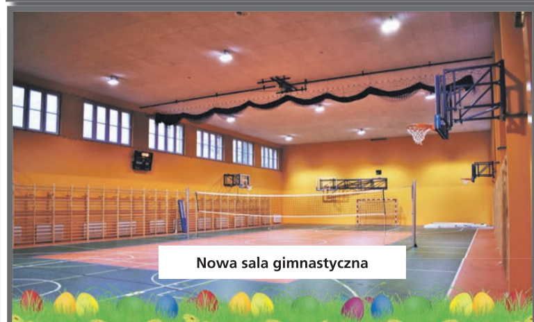
Nowa sala gimnastyczna