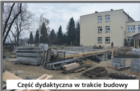
Część dydaktyczna w trakcie budowy