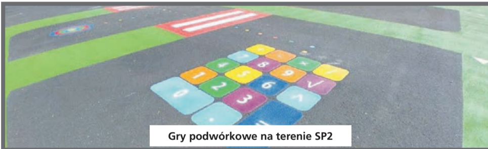
Gry podwórkowe na terenie SP2

W lutym 2021 roku Gmina Łędziny zgłosiła do konkursu innowacji samorządowych dwie inwestycje, powstałe na terenie Szkoły Podstawowej nr 2 pod nazwą: „Miasteczko ruchu drogowego” oraz „Ogród Sensoryczny”.