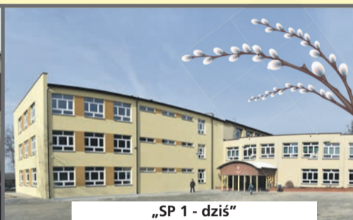
„SP 1 - dziś”

Konkurs plastyczny „Moje najpiękniejsze miejsce w Łędzinach” skierowany jest dla uczniów szkół podstawowych uczęszczających do klas 1-3. Uczniowie w ramach konkursu wykonują prace plastyczne w dowolnej technice oraz w dowolnej formie związanej z tematyką Konkursu.