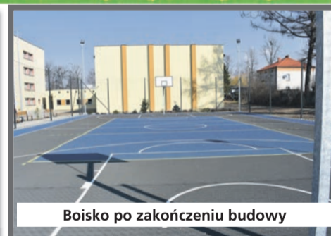
Boisko po zakończeniu budowy