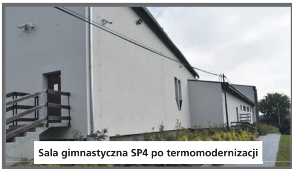
Sala gimnastyczna SP4 po termomodernizacji

Należy przypomnieć, że w latach 2018-2019 w szkole wykonana została termomodernizacja budynku na kwotę 1 869 449,29 zł. Na wykonanie termomodernizacji Gmina Łędziny uzyskała dofinansowanie z Wojewódzkiego Funduszu Ochrony Środowiska i Gospodarki Wodnej w Katowicach w kwocie 130 682,00 zł.