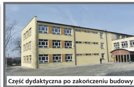
Część dydaktyczna po zakończeniu budowy