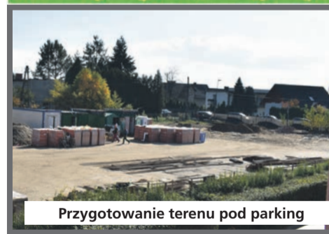
Przygotowanie terenu pod parking