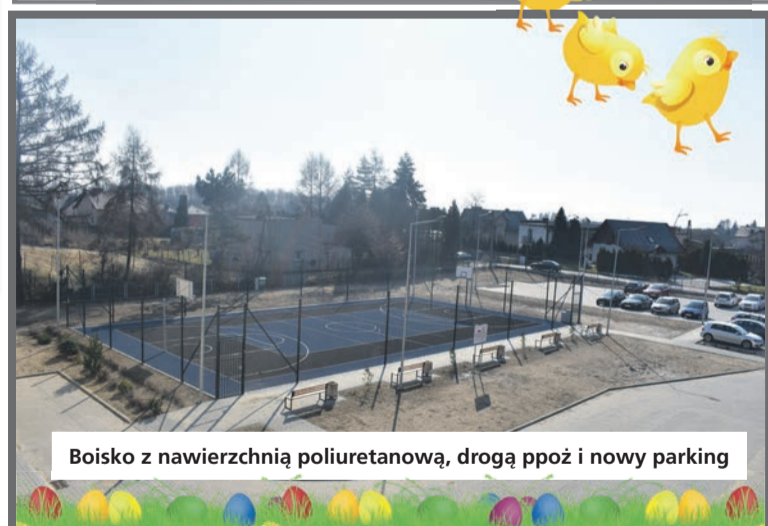
Boisko z nawierzchnią poliuretanową, drogą ppoż i nowy parking

Burmistrz Miasta wraz z pracownikami Urzędu Miasta