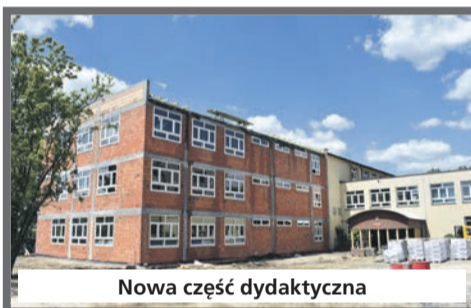
Nowa część dydaktyczna