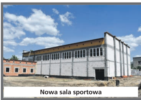
Nowa sala sportowa