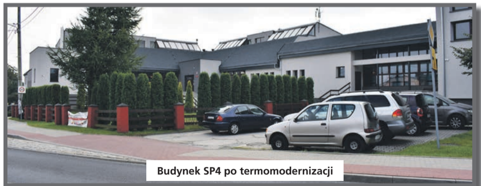
Budynek SP4 po termomodernizacji

Podobnie jak w Szkole Podstawowej nr 2 tak i w SP4 trwają prace nad wykonaniem dokumentacji wraz z pozwoleniem na budowę.