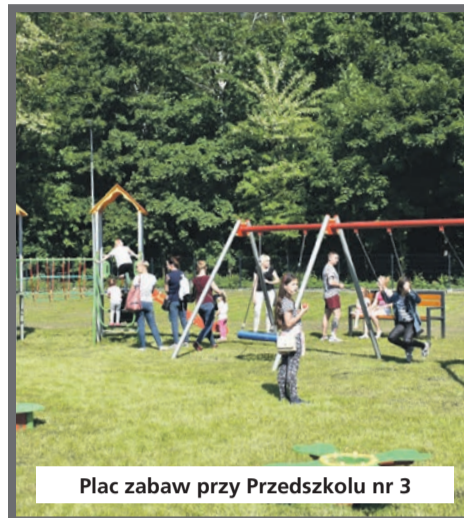
Plac zabaw przy Przedszkolu nr 3

Do nowo wybudowanego Przedszkola nr 3 w 2019 roku zostały przeniesione dzieci z wyżej wymienionych oddziałów przedszkolnych. W tym samym roku 2019 rozpoczęto rozbudowę Szkoły Podstawowej nr 1 w Łędzinach.