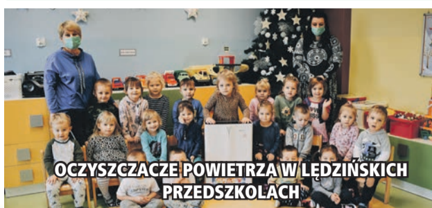
OCZYSZCZACZE POWIETRZA W LĘDZIŃSKICH PRZEDSZKOLACH