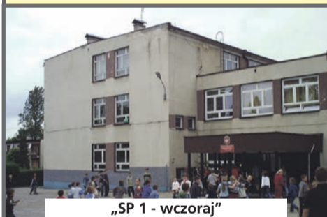
„SP 1 - wczoraj”

Konkurs fotograficzny „Łędziny wczoraj i dziś” skierowany jest do uczniów szkół podstawowych uczęszczających do klas 4-8. W ramach konkursu uczniowie ukążą na fotografiach zmiany zachodzące na terenie miasta. Fotografie wykonane w minionych 30 latach wykonane na terenie Łędzin połączone zostaną z aktualnymi zdjęciami ukazując przemiany zachodzące na terenie miasta.