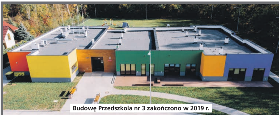
Budowę Przedszkola nr 3 zakończono w 2019 r.

Budowa Miejskiego Przedszkola nr 3 przy ul. Paderewskiego w Łędzinach w latach 2018-2019 była ściśle powiązana z rozbudową Szkoły Podstawowej nr 1.