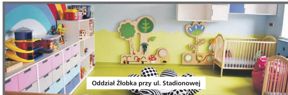
Oddział Żłobka przy ul. Stadionowej

Przypomnieć także należy, że następne dwa oddziały Miejskiego Żłobka w Łędzinach powstały w 2019 roku na drugim piętrze przedszkola nr 1 wraz z windą.