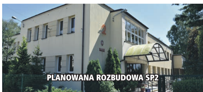
PLANOWANA ROZBUDOWA SP2