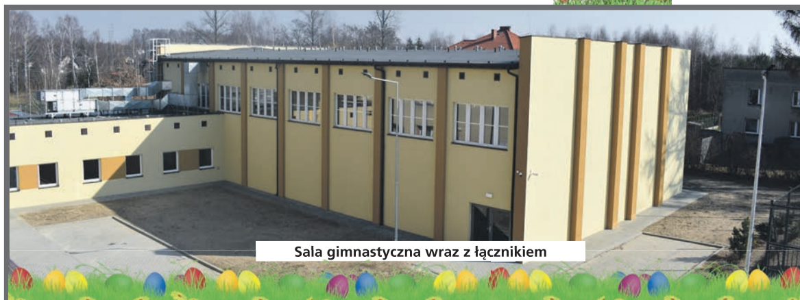
Sala gimnastyczna wraz z łącznikiem