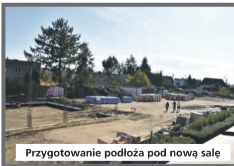
Przygotowanie podłoża pod nową salę