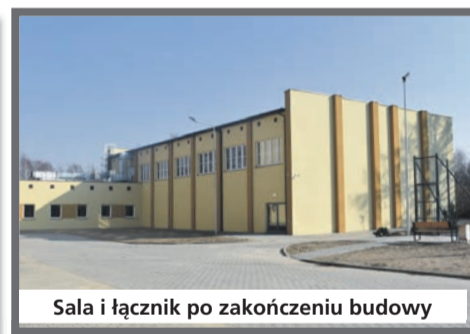
Sala i łącznik po zakończeniu budowy