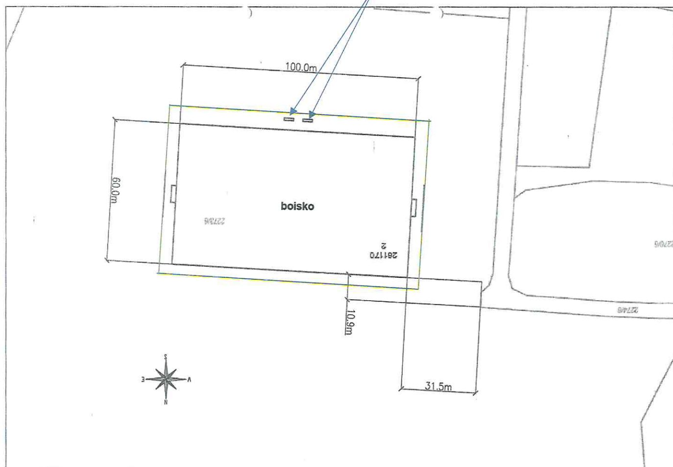
Rys. 2. Zagospodarowanie terenu

Lokalizacja dwóch wiat dla zawodników rezerwowych (szczegóły zostaną doprecyzowane podczas wizji w terenie)