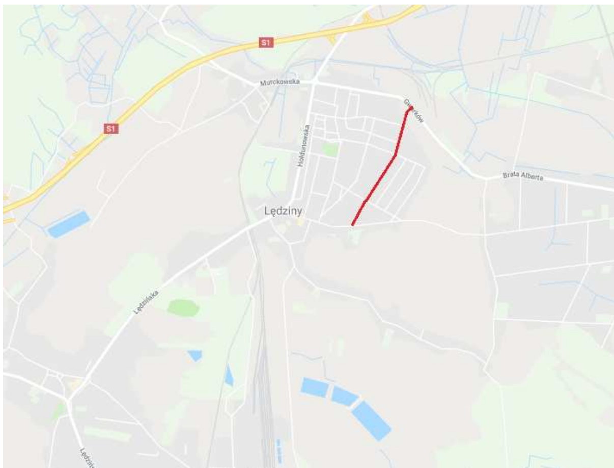
Ryc. 1 Lokalizacja dróg rowerowych na terenie Gminy Łędziny