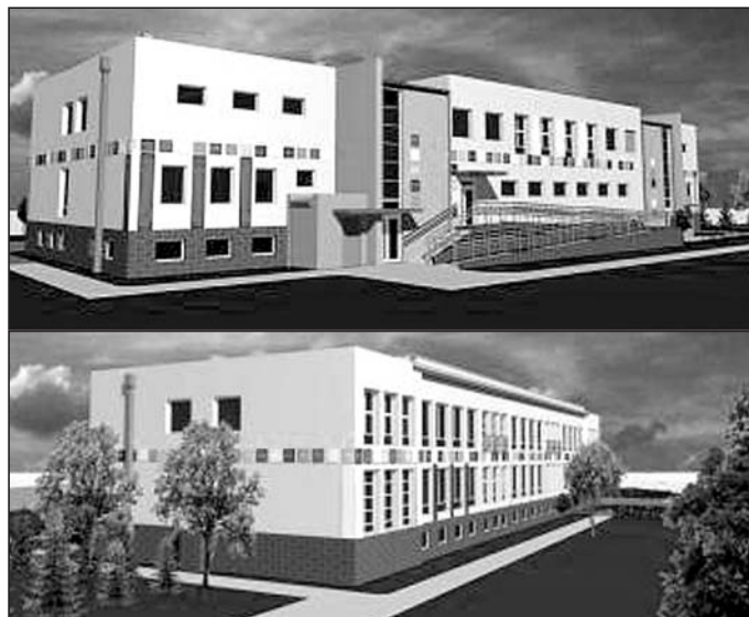
Tak będzie po przebudowie.

wraz z jadalnią oraz pomieszczenia pomocnicze: pralnie, szwalnie, magazyny, kotłownia itp. Na parterze i piętrze budynku będą sale zajęć z sanitariatami