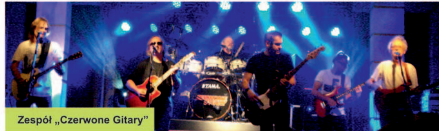
Zespół „Czerwone Gitary”

W godzinach wieczornych zespół „Czerwone Gitary” porwał przybyłych do świata muzycznych wspomnień. Koncert był wyjątkowy, a tak licznie zgromadzonej publiczności Plac Farski jeszcze nie widział. Oklaskom dla artystów nie było końca. Z każdym kolejnym przebojem atmosfera stawała się bardziej gorąca. Publiczność tańczyła, śpiewała i co rusz nagradzała artystów gromkimi brawami za piękne i dziś już kultowe piosenki. Wszystkim mieszkańcom serdecznie dziękujemy za przybycie i chwile spędzone w radosnej festynowej atmosferze!