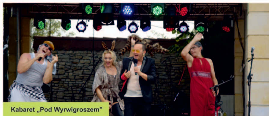
Kabaret „Pod Wirwigroszem”

W godzinach wieczornych zespół „Czerwone Gitary” porwał przybyłych do świata muzycznych wspomnień. Koncert był wyjątkowy, a tak licznie zgromadzonej publiczności Plac Farski jeszcze nie widział. Oklaskom dla artystów nie było końca. Z każdym kolejnym przebojem atmosfera stawała się bardziej gorąca. Publiczność tańczyła, śpiewała i co rusz nagradzała artystów gromkimi brawami za piękne i dziś już kultowe piosenki. Wszystkim mieszkańcom serdecznie dziękujemy za przybycie i chwile spędzone w radosnej festynowej atmosferze!