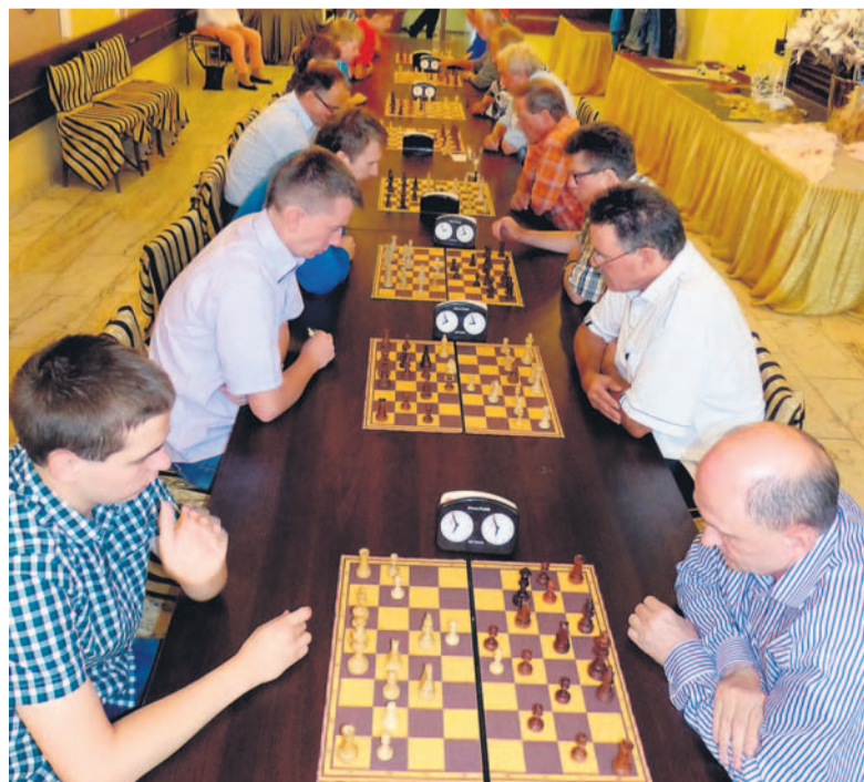
KS Górnik Łędziny kontra SK Altrip.