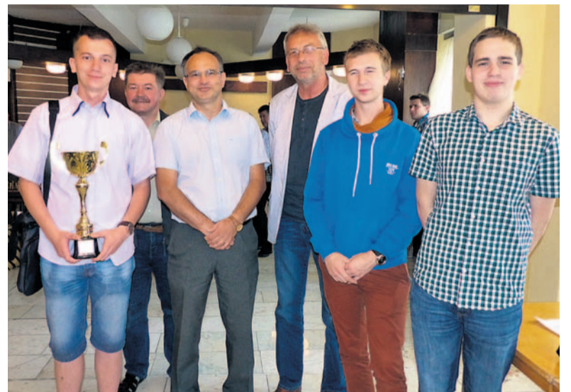
Zwycięzcy turnieju gry błyskawicznej.

Burmistrz coraz częściej daje się namówić działaczom szachowym do gry przy „desce”, więc bardzo chętnie wręczył też puchary, nagrody i dyplomy ufundowa-