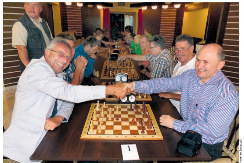
Po zakończonej partii - przyjacielskie podanie ręki.