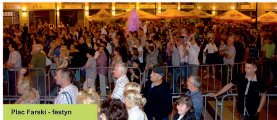
Plac Farski - festyn