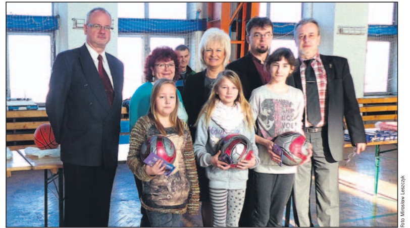
13 lutego dokonano podsumowania ferii.