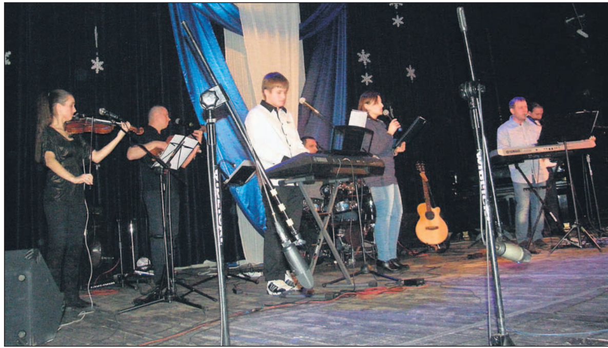
Kołęda Przyjaciół na scenie.

W dniu 30 stycznia br. w sali widowiskowo – kinowej „Piast”, Miejski Ośrodek Kultury w Łędzinach zorganizował galę VI Przeglądu Kołęd, Pastorałek i Jasełek, podczas której wręczono laureatom dyplomy i nagrody.