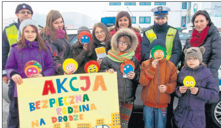
Uczestnicy akcji „Bezpieczna rodzina na drodze”.

► W dniu 2 lutego uczestnicy Świetlicy Socjoterapeutycznej Miejskiego Ośrodka Pomocy Społecznej w Łędzinach wraz z funkcjonariuszami Komendy Powiatowej Policji w Bieruniu przeprowadzili akcję pod hasłem: „Bezpieczna rodzina na drodze” pod patronatem Burmistrza Miasta Łędziny Krystyny Wróbel. W ramach działań sprawdzano trzeźwość i dokumentację kierowców. Kierowcy, którzy wykazali się odpowiedzialnością oraz znajomością przepisów drogowych zostali wyróżnieni Medalem Wzorowego Kierowcy, re-