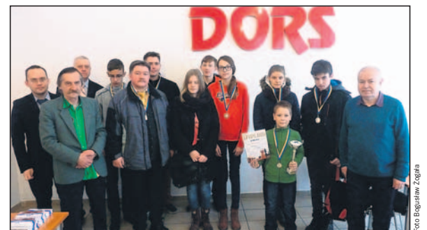
Drużyna MOK zajęła drugie miejsce w drużynowych zawodach juniorów.

Z końcem stycznia rozstrzygnęły się także Drużynowe Rozgrywki Juniorów o Puchar Dors-Klimczok,