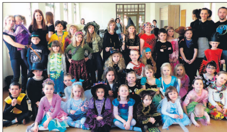
Uczestnicy balu przebierańców na Placu Farskim.

palem lepili, co tylko im podpowiedziała fantazja: zwierzątka, ludziki, serduszka i tajemnicze stwory. Odbywały się również warsztaty plastyczne: „Bibułkowe kwiaty z wiejskiego ogrodu” i „Z gliną za pan brat”. Podczas warsztatów plastyczno-dogoterapeutycznych dzieci zapoznawane były z zasadami bezpiecznego zachowania się w obecności psów. Wykonywały plakaty przedstawiające ich ulubione rasy czworonogów oraz obejrzały pokaz psich sztuczek. Dzieci zrobiły również papierowe psie maski oraz kartkę pocztową z wizerunkiem szczeniaka. Podczas zajęć odbył się też wspólny spacer z psem połączony z lepieniem figur czworonogów ze śniegu. Proponowano uczniom również zajęcia muzyczne – ruchowe, zajęcia sportowe, w tym Kung-Fu. Ponadto, podczas ferii odbywały się szkolenia komputerowe z realizowanego w mieście projektu „Eliminacja wykluczenia cyfrowego w gminie Łędziny”.