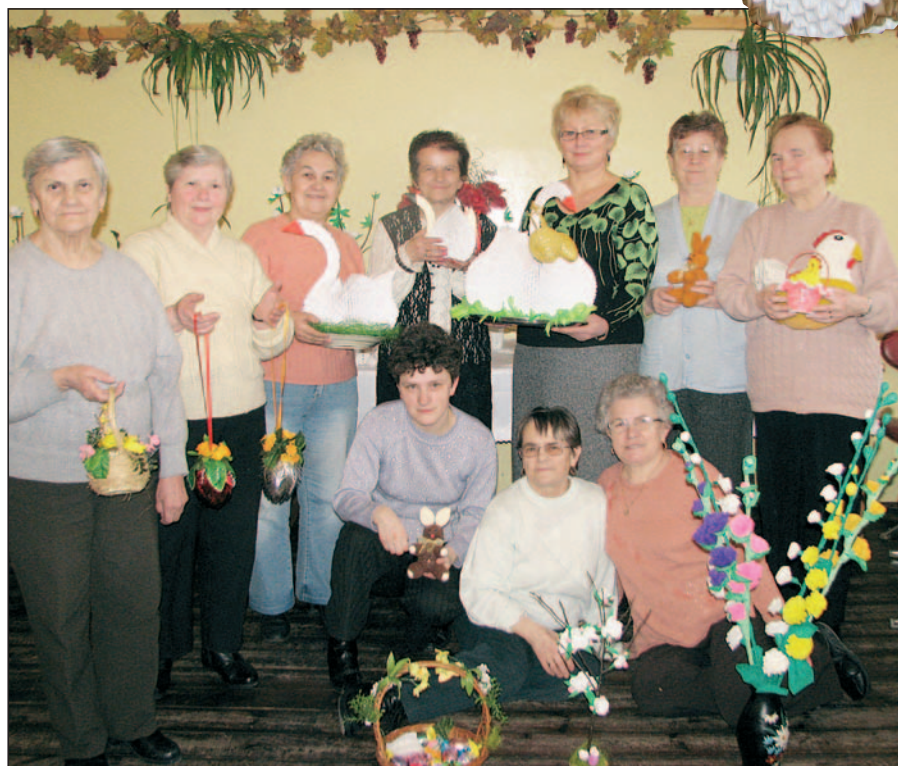
Panie z DDPS prezentują wykonane przez siebie ozdoby wielkanocne.