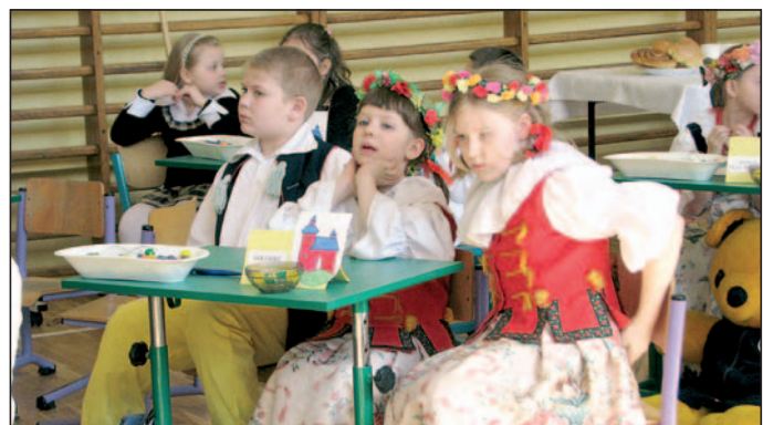
Drużyna z Goławca.

– W ramach serii „Widziane z Górki Klemensowej” planujemy wydanie publikacji na temat szkoły, która ma uzupełnić zeszyt pt. „Szkoła Podstawowa nr 1 im. Karola Miarki w Łędzinach”, autorstwa Ewy Łakotowej, wydany w 1999 roku z okazji jubileuszu 60-lecia placówki. Pod hasłem „Jubileusz 70-lecia szkoły”, 4 czerwca w sali „Piast” odbędzie się uroczystość w ramach dorocznych Spotkań Przyjaciół Szkoły z udziałem absolwentów, władz, naszych licznych przyjaciół i sympatyków. Końcowym akcentem będzie doroczny czerwcowy festyn szkolny w ramach Dni Łędzin. /wm/