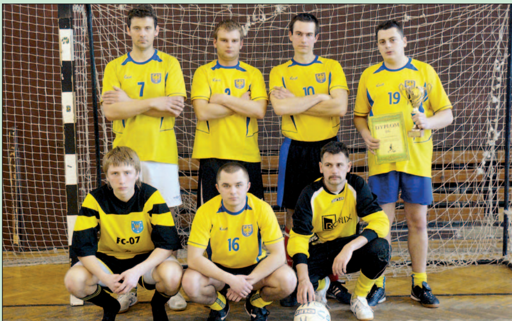
Wicemistrzowie Memoriału im. Stanisława Koisa z pucharem.

Finałowej imprezie towarzyszyło wiele emocji, które dodatkowo udało się połączyć z celem charytatywnym. Wszystko to sprawia, że rozgrywki GLH na stałe wpisały się w kalendarz łędzińskiego sportu i cieszą się coraz większym zainteresowaniem. Z pewnością podobnie będzie i w przyszłym roku. Na razie piłkarze – główni aktorzy zmagania – wracają na zielone boiska.