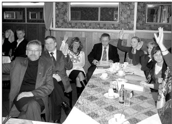
Jedno z głosowań.