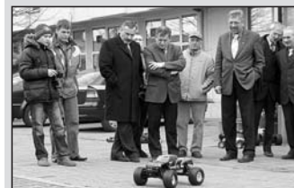
Pokaz obok budynku Urzędu Miasta.

Zapraszamy do obejrzenia wystawy modeli w holu naszego ratusza. Towarzyszący jej otwarciu pokaz wzbudził szczerze zainteresowanie nie tylko modelarzy.