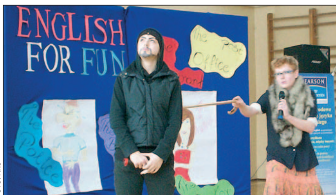
Angielska flegma z żywiołowym polskim humorem.