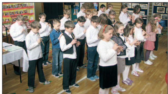
Młodzi fleciści z SP nr 1.

► Uczniowie przedstawiali najistotniejsze fakty z dziejów swoich szkół, porównywali ich wygląd i wyposażenie dawniej i dziś. Prezentacja ta poprzedzo-