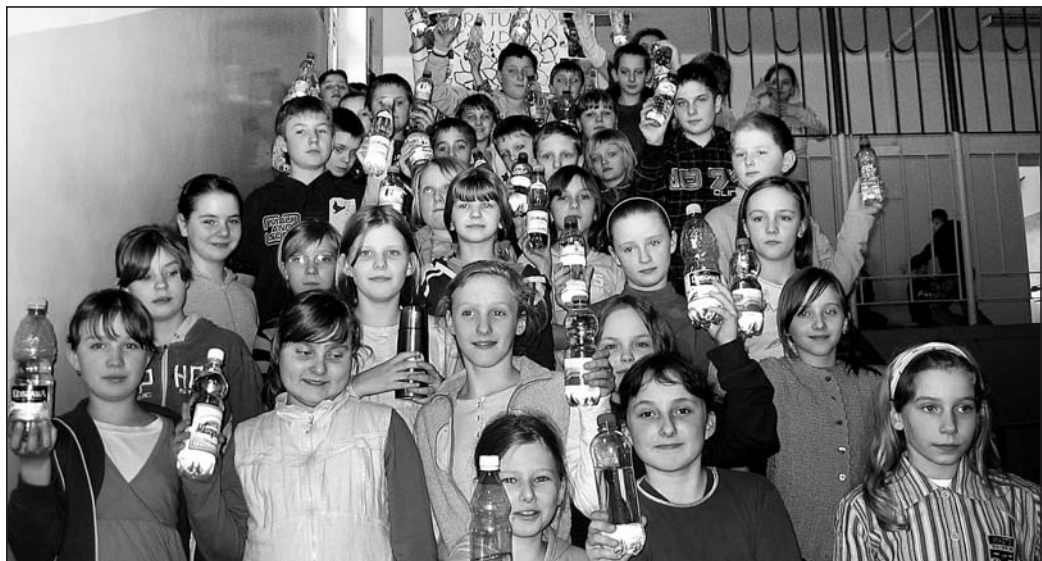
Dzieci i woda - bezcenne dobro naszej planety.

W poprzednich latach SP 3 brała udział w działaniach PAH. Ich koordynatorką w szkole była Regina Karwicka. /wm/