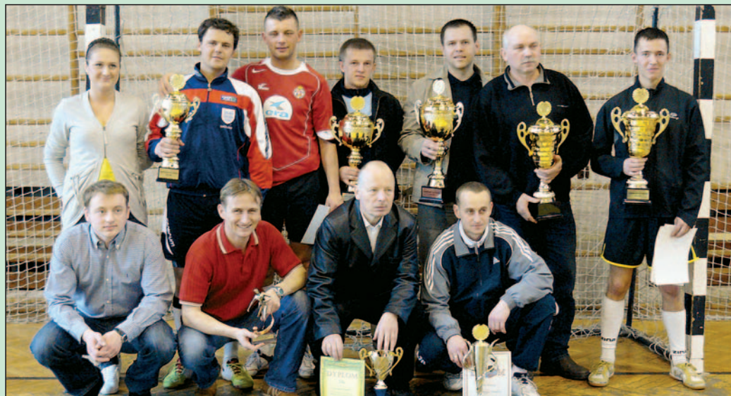
Przedstawiciele drużyn i wyróżnieni indywidualnie w I lidze.

Przejdźmy jednak do podsumowania wyników rywalizacji sportowej. Bezapelacyjnym zwycięzcą tegorocznych rozgrywek jest zespół CB&S Łędziny, który nie tylko zwyciężył w lidze, ale też odniósł tryumf w rozgrywkach Pucharu Ligi.