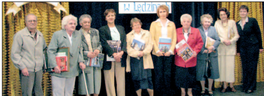
Grupa wyróżnionych najwierniejszych i najaktywniejszych czytelników biblioteki.