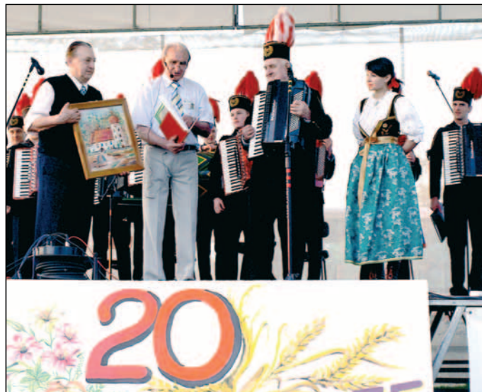
Akordeoniści z kopalni Kleofas otrzymali na pamiątkę obraz.