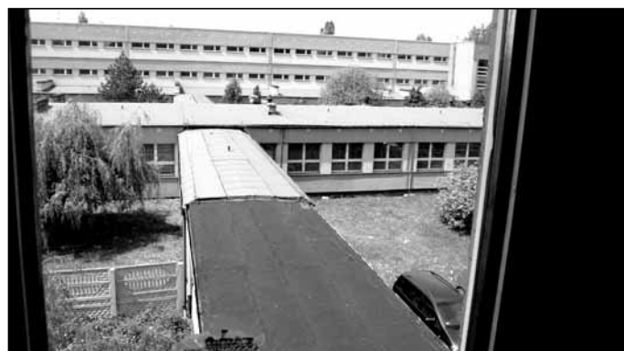
Budynek połączony jest "przewiązką" z Powiatowym Zespołem Szkół (widok z okna).

Dyrekcja, grono pedagogiczne, pracownicy administracji obsługi Szkoły Podstawowej z Oddziałami Integracyjnymi nr 1 im. Karola Miarki w Łędzinach