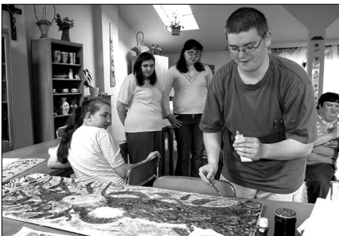
W Warsztacie Terapii Zajęciowej Ośrodka Błogosławiona Karolina.

2. Caritas Archidiecezji Katowickiej (w Łędzinach działa Ośrodek Błogosławio- na Karolina, należący do struktur Caritasu). Adres: 40-042 Katowice, ul. Ks. Bp. Czesława Domina 1. Numer wpisu do KRS: 0000221725. Konto bankowe 1% podatku PLN: 66 1020 2313 0000 3102 0020 0220. /um/