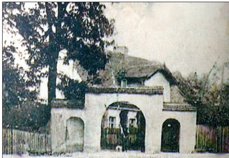
Brama na starej fotografii.

Może - podpowiadamy - uda się znaleźć sponsora, który podejmie się odbudowy bramy na przykład w zamian za dyskretną reklamę lub pamiątkową inskrypcję? lml