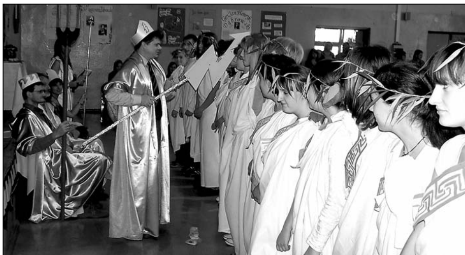
Pasowanie na uczniów szkoły podczas Szkolnego Dnia Integracji i Tolerancji.

Logistyka to przepływ materiałów, informacji i pieniędzy w przedsiębiorstwach i między nimi. Do najpopularniejszych branż, które poszukują logistyków należą: transport, spedycja, przemysł, budownictwo, handel i usługi oraz informatyka i telekomunikacja. Stanowiska pracy, o które może ubiegać się specjalista z zakresu logistyki to: logistik, spedytor krajowy i międzynarodowy, dyspozytor, specjalista d/s magazynowania i organizacji.