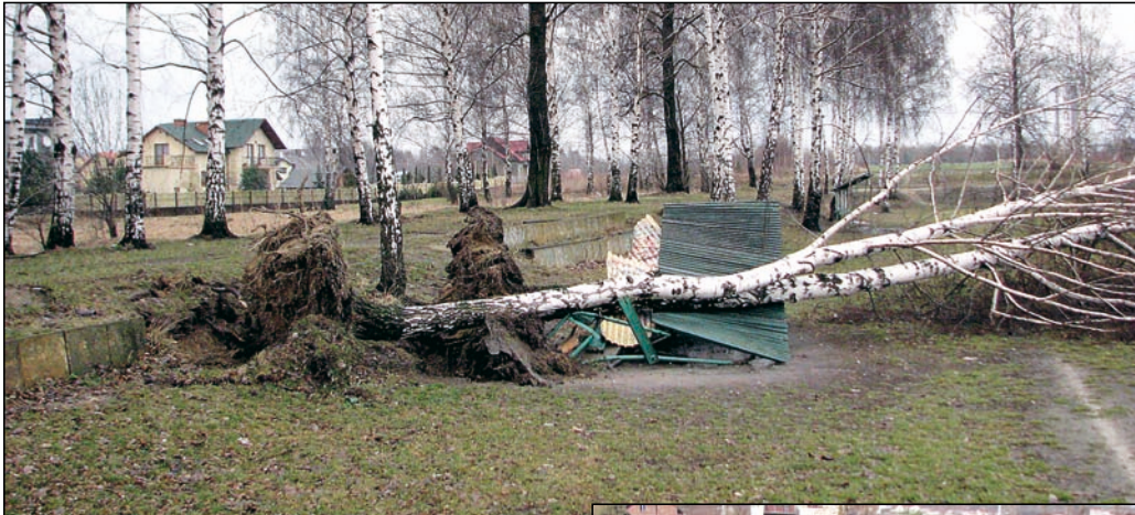
Emma zniszczyła wiatę dla piłkarzy.

▶ Na początku marca o miano największego niszczyciela w Łędzinach walczyli orkan Emma i miejscowi wandale. Orkan m.in. przewrócił dwie dorodne brzozy na blaszaną wiatę dla zawodników obok boiska piłki nożnej przy ul. Asnyka, czym spowodował całkowite jej zniszczenie (skutki tego zdarzenia usunęła - na zlecenie Urzędu Miasta - firma Ekorec).