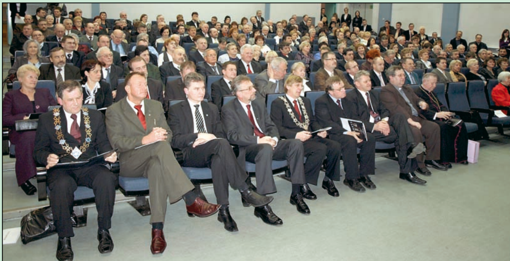
Sala "Piast" była pełna gości. W pierwszym rzędzie zasiedli przedstawiciele powiatu, Lędzin oraz laureaci i ich laudatorzy.

Działalność Laureata jako bezpośredniego organizatora oraz aktywnego uczestnika wielu wydarzeń kulturalnych, w tym zwłaszcza muzycznych, znana jest w powiecie i poza jego granicami. Podobnie działalność w zakresie upowszechniania muzyki chóralnej, w której to dziedzinie Laureat szczególnie realizuje się jako sponsor, organizator i chórzysta jednocześnie.