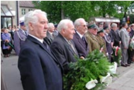
Duma Wojska Polskiego - Kombatanaci II Wojny Światowej

Mieszkańcy i władze Łędzin uczcili w sposób godny tegoroczne uroczystości. O godz. 15:00 rozpoczęła się msza święta w kościele św. Anny. Po zakończeniu uroczystości kościelnych wszyscy zgromadzeni wspólnie przemaszewali pod Pomnik Weteranów Powstań Śląskich. O 16:00 pod pomnikiem odbył się Apel Poległych. Przedstawiciele władz samorządowych, kombatanaci i przybyli goście wygłosili przemówienie, w których oddali hołd wszystkim tym, którzy walczyli o wolność ojczyzny.