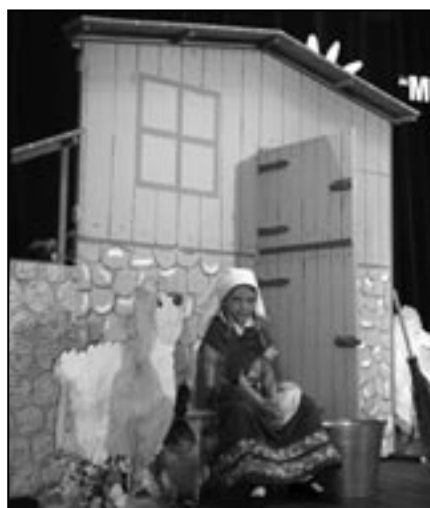
Podczas III Spotkania z Muzyką Klasyczną w roli gospodyni wiejskiej zagrody wystąpiła sześciolatka Ewelina Ficek.

24 i 25 maja w Sali widowiskowo-kinowej „Piast” maluchy i nauczycie z Przedszkola nr 2 zorganizowali III Spotkanie z Muzyką Klasyczną. W tym roku przedszkolaki wystąpiły w scenarii wiejskiej zagrody. Inscenizacje przygotowane do znanych utworów klasycznych, wiersze i piosenki w gwarze śląskiej i nie tylko zachwyciły wszystkich przybyłych gości - którymi byli rodzice i dziadkowie występujących maluchów.