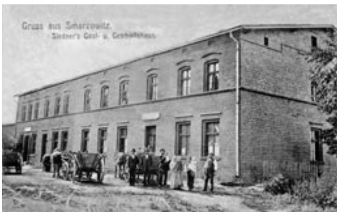
Zdjęcie z początku XX w. - budynek przy ul. Hołdunowskiej.

Każda rocznica, niezależnie od tego czy dotyczy ona rodziny, państwa, czy też zakładu pracy, skłania do zadumy i wspomnień. Obecny rok 2005 to okazja do świętowania kilku ważnych rocznic. 9 maja wspólnie obchodziliśmy uroczystości zakończenia II Wojny Światowej. Zaledwie kilka dni później, bo już w dn. 13 maja 60 rocznicę świętowali członkowie Spółdzielni „Jedność”. Warto przypomnieć kilka dat, osób i aspektów tworzących historię tej spółdzielni, której początków nieodzownie szukać należy w Łędzinach.