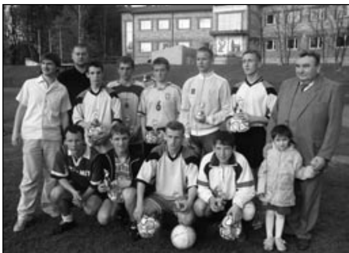
Zwycięzcy turnieju, burmistrz miasta i organizatorzy.

W dn. 1 maja 2005 odbył się Pierwszy Turniej Piłki Nożnej - Family Cup 2005. Mamy nadzieję, że wpisze się on do kalendarza imprez sportowych organizowanych w mieście.