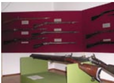
Broń strzelecka XIX wieku, wystawa czynna do 1 połowy kwietnia