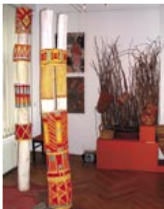
Sztuka Australijskich Aborygenów

Szanowni Czytelnicy! W ostatnim czasie Redakcja BIL-a nawiązała współpracę ze śląskimi instytucjami kulturalnymi. Efektem tej współpracy są m.in. informacje o aktualnych wystawach oraz bezpłatne zaproszenia dla czytelników BIL-a na każdą z organizowanych w Muzeum Śląskim wystaw. Czytelnicy, którzy zgłoszą w Redakcji (telefonicznie bądź osobiście) chęć zobaczenia przygotowanych ekspozycji otrzymają bezpłatne zaproszenia dla dwóch osób. Obowiązuje każdorazowo kolejność zgłoszeń. Tradycyjnie w losowaniu nie biorą udziału pracownicy UM.