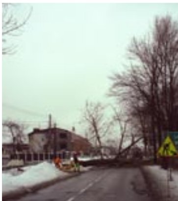
ul. Łędzińska - wycinka starych drzew zagrażających znajdującym się w pobliżu domostwom

ubiegłego roku wnioskowały o wycinkę drzew zagrażających ich domostwom.