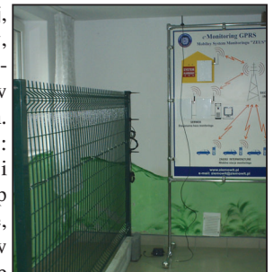
Autorski produkt firmy "e-Monitoring ZEUS".