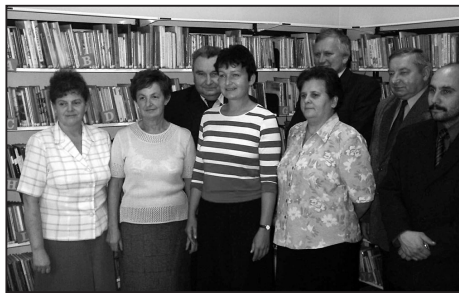
Oficjalne otwarcie Miejskiej Biblioteki w Łędzinach.

Wykonanie ww. prac remontowych zajęło prawie trzy miesiące, ale efekt przemawia jednak sam za siebie i można już powiedzieć, iż warto było doczekać końca modernizacji MBP. Stali czytelnicy już po przestąpieniu progów zauważyli, że nareszcie zniknął nieprzyjemny zapach stęchlizny znany z lat poprzednich. Polepszyły się warunki estetyczne, a dzięki temu również standard świadczonych usług. Cel nadrzędny remontu – likwidacja wilgoci i pleśni zagrażającej zdrowiu pracowników i czytelników oraz księgozbiorowi biblioteki, został osiągnięty.