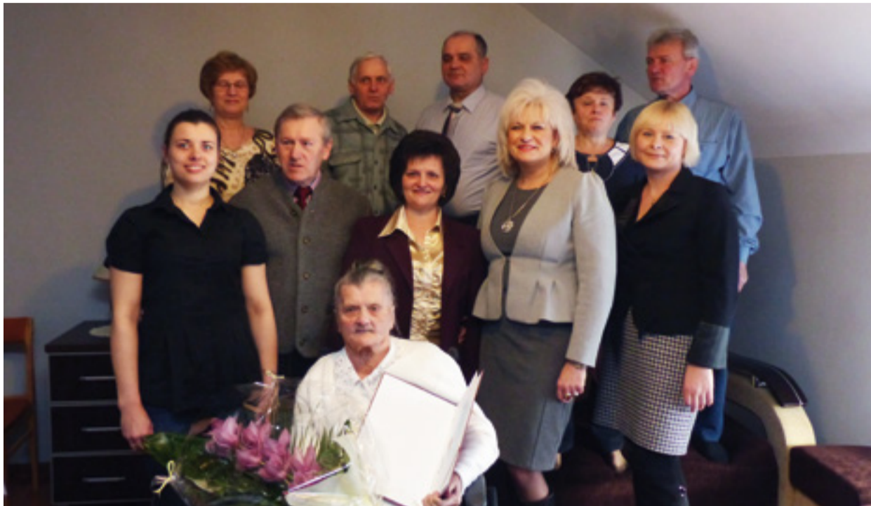
Jubilatka i jej goście