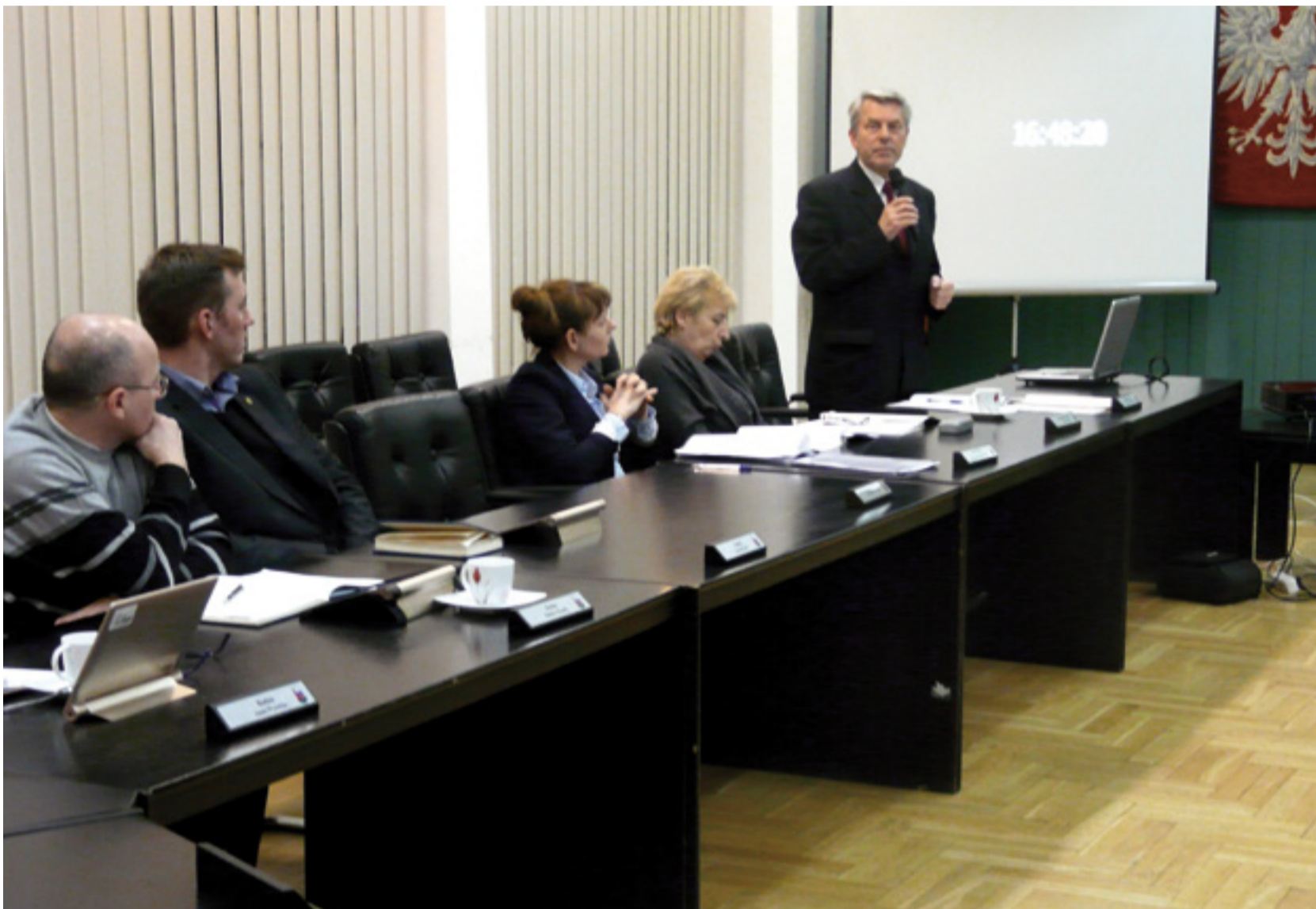
Senator Czesław Ryszka podczas obrad komisji infrastruktury namawiał samorządowców do wystosowania stanowiska w sprawie S1

30 grudnia ub.r. odbyło się uroczyste otwarcie nowego żłobka, który pomoże pomieścić 32 dzieci w wieku od 20 tygodni do 3 lat. Maluchy uczęszczają do placówki od 4 stycznia.