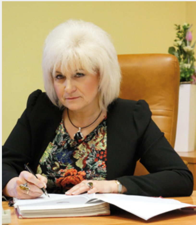
Burmistrz Krystyna Wróbel