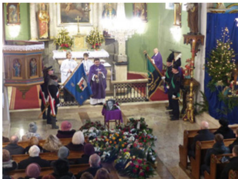
Uroczystości pogrzebowe w kościele św. Klemensa