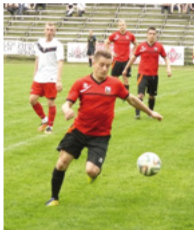
MKS w czasie meczu.