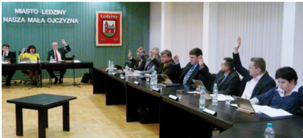
Rada Miasta w czasie jednego z głosowań

Na ostatniej, 22. sesji Rady Miasta podejmowano tematy dróg, szkolnictwa i cen wody. Radni wykazali się dużą sprawnością – obrady trwały bardzo krótko – i jednomyślnością, ponieważ większość uchwał przyjęto jednogłośnie.