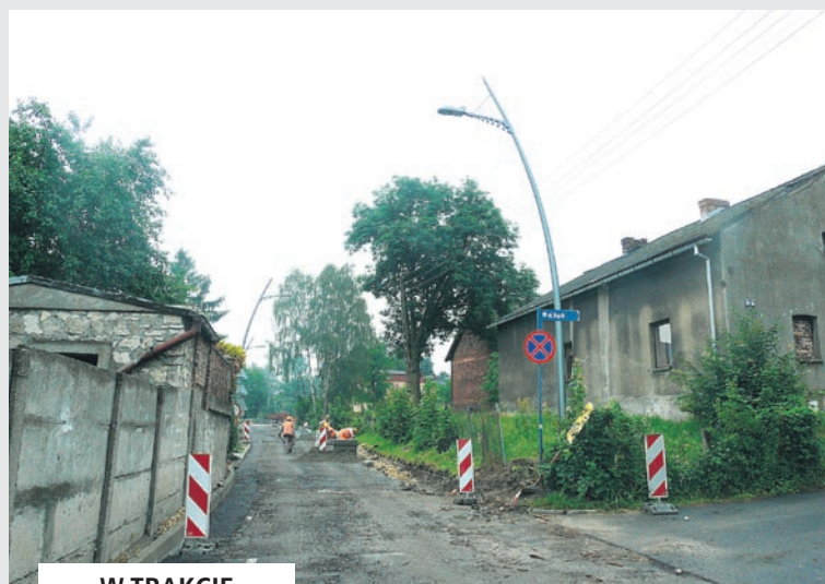
W TRAKCIE MODERNIZACJI

● Po kilku latach oczekiwania, strażacy OSP doczekali się nowego wjazdu do budynku Ochotniczej Straży Pożarnej. Wykonano tam prace związane z wyprofilowaniem podbudowy i położeniem nawierzchni asfaltobetonowej. Koszt tego przedsięwzięcia to 23 tys. zł.