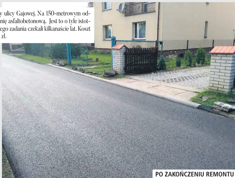
PO ZAKOŃCZENIU REMONTU

● Zakończył się remont drogi przy ulicy Gajowej. Na 150-metrowym odcinku drogi położono nawierzchnię asfaltobetonową. Jest to o tyle istotne, że mieszkańcy na realizację tego zadania czekali kilkanaście lat. Koszt jego wykonania to około 60 tys. zł.