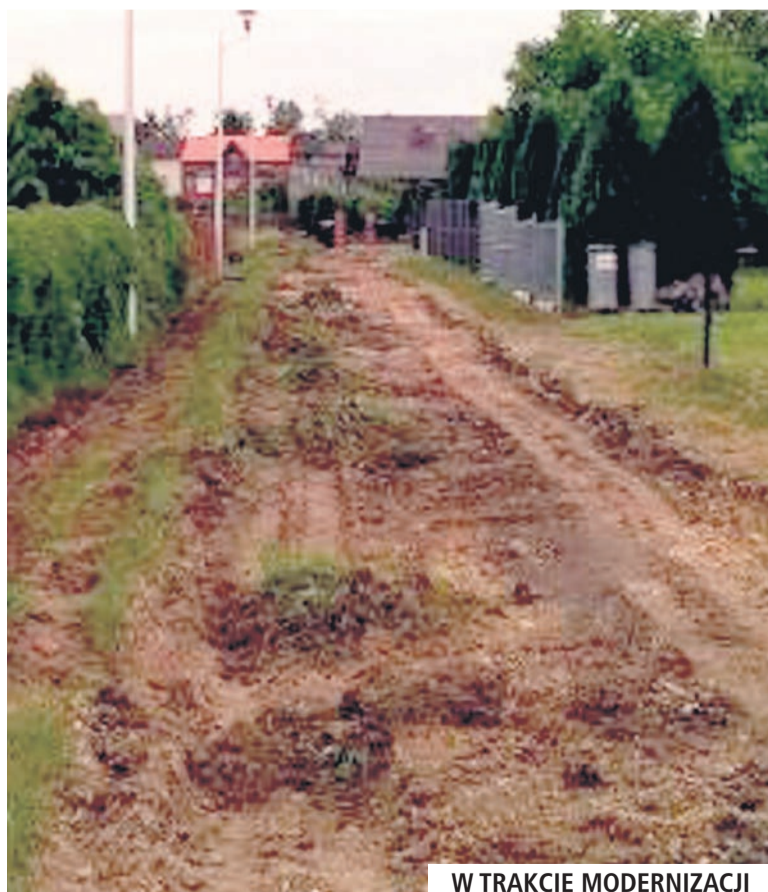
W TRAKCIE MODERNIZACJI