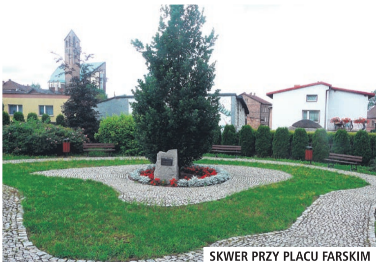
SKWER PRZY PLACU FARSKIM

• Jak co roku latem, nasze miasto zostało pięknie ukwiecone. Zagospodarowano przestrzeń na łędziniskich skwerach, wykonano prace porządkowe i ogrodnicze, a także nasadzono sporo nowej roślinności.