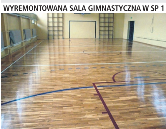
WYREMONTOWANA SALA GIMNASTYCZNA W SP 1