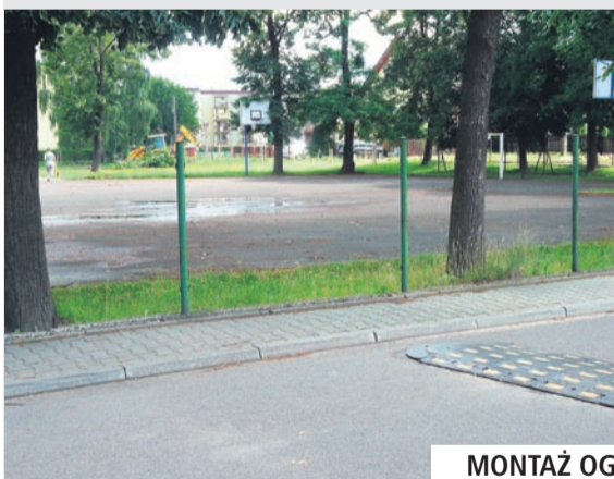
MONTAŻ OGRODZENIA W G2