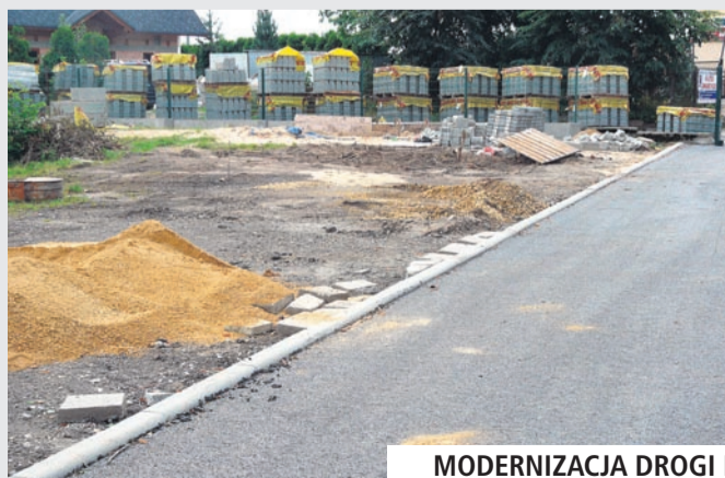
MODERNIZACJA DROGI PRZECIWPÓŻAROWEJ W SP1