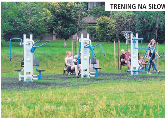
TRENING NA SIŁOWNI „POD CHMURKĄ”