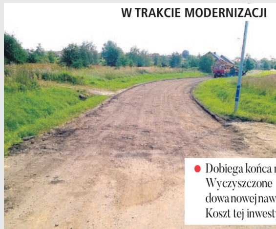
W TRAKCIE MODERNIZACJI