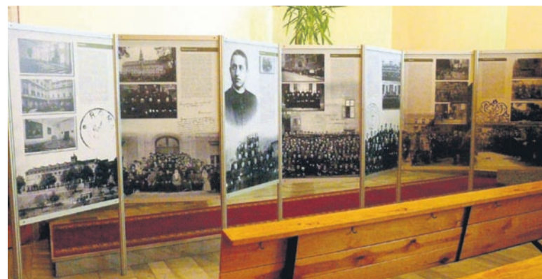
Wystawa w kościele Chrystusa Króla w Hołdunowie.

Polski (od 1926 r.) oraz kardynałem (od 1927 r.). Okres II wojny światowej spędził na przymusowej emigracji we Włoszech, Francji, Szwajcarii i w Niemczech, będąc w tym czasie jedynym polskim hierarchą w randze kardynała. Po powrocie do kraju w 1945 r. został rok później arcybiskupem gnieźnieńskim i warszawskim. W nowej rzeczywistości ustrojowej państwa do śmierci w 1948 r. zasłużył na miano Niezlomnego Prymasa, który w nowej