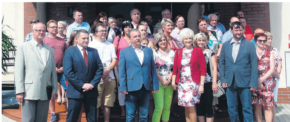
Spotkanie w Kopalni Ziemowit.