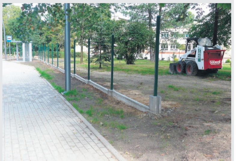
MONTAŻ OGRODZENIA W SP1