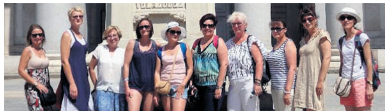
Nauczycielki G2 w Hiszpanii.

Dziewięcioro nauczycieli z holdurowskiego Gimnazjum nr 2 uczestniczyło w dniach 23-29 lipca w kursie „Creativity in Teaching and Learning using ICT : The Digital Classroom”, finansowanym ze środków Unii Europejskiej w ramach Projektu Operacyjnego Wiedza Edukacja Rozwój, opartego na zasadach projektów Erasmus +.