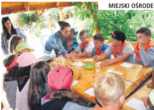
MIEJSKI OŚRODEK KULTURY