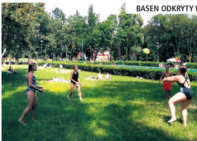
BASEN ODKRYTY W OŚRODKU ZALEW