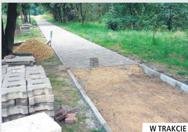
W TRAKCIE MODERNIZACJI