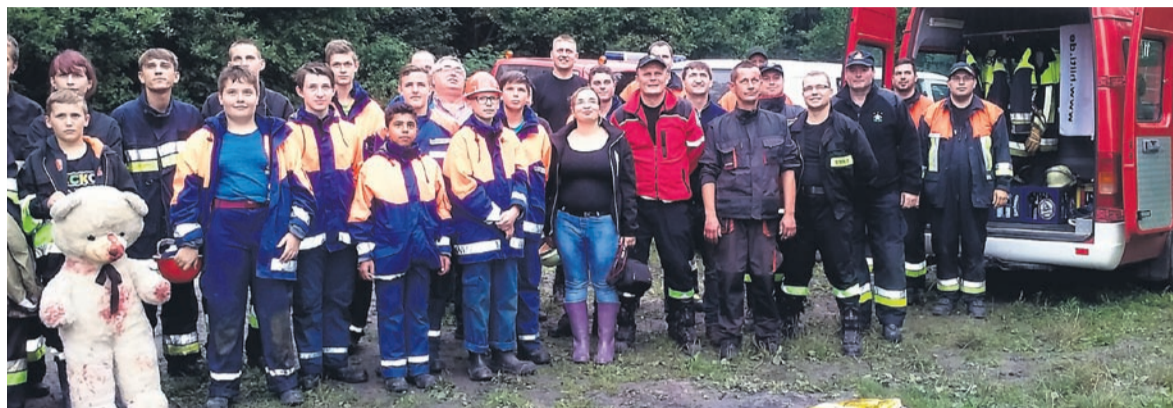
Drużyny młodzieżowe OSP Lędziny i FFW Mitterteich.

W dniach 16-21 lipca na terenie Lędzin i okolic odbył się obóz strażacki zorganizowany przez lędzińską Ochotniczą Straż Pożarną. Udział wzięli w nim również przedstawiciele zaprzyjaźnionej jednostki FFW Mitterteich w Niemczech.