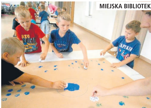
MIEJSKA BIBLIOTEKA PUBLICZNA