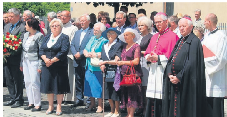
Odsłonięcie pomnika Prymasa Augusta Hlonda w Katowicach.

Pomimo że Prymas nie dożył sędziwego wieku, to jego 67 lat życia da się przypisać do czterech ważnych okresów najnowszej historii Polski. I tak dzieciństwo i wczesną młodość (1881-1893) spędził na polskim Górnym Śląsku, należącym jednak od kilku wieków do Niemiec. Kolejne 7 lat przebywał we Włoszech, dojrzewając w wierze, ucząc się i studiując. Z kolei w latach 1900-1909 kierował salezjańskimi zakładami w Oświęcimiu, Krakowie i Przemyślu. Następnie przez kolejnych 13 lat pracował w Wiedniu,