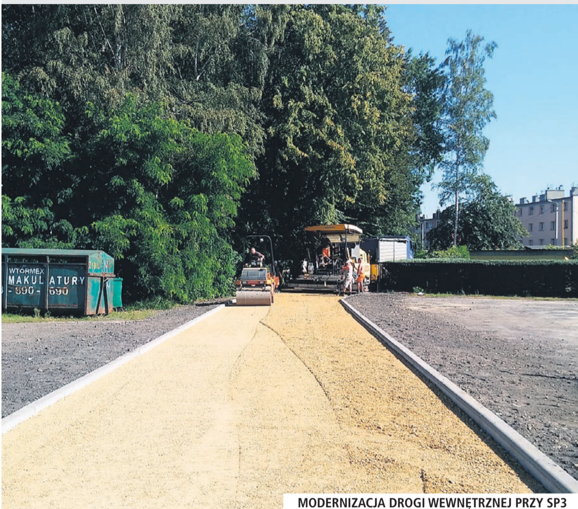
MODERNIZACJA DROGI WEWNĘTRZNEJ PRZY SP3

• Bardzo wiele remontów i innych inwestycji zrealizowano latem w placówkach oświatowych. W Szkole Podstawowej nr 1 i w Gimnazjum nr 2 zainstalowane zostały nowe ogrodzenia. Ponadto w SP 1 kończona jest modernizacja drogi przeciwpożarowej, trwa utwardzanie terenu. W części kuchennej Przedszkola nr 2 zainstalowano klimatyzację. Pracownicy kuchni w Miejskim Przedszkolu nr 2 na realizację tej inwestycji czekały od roku 2010. W sumie w tej części placówki przedszkola znalazło się siedem nowoczesnych klimatyzatorów. W okresie wakacyjnym odświeżone zostały pomieszczenia w szkołach. W Szkole Podstawowej nr 1 wyremontowano salę gimnastyczną. Parkiet został wycyklinowany, a ściany i okna wyczyszczone przez profesjonalną firmę.