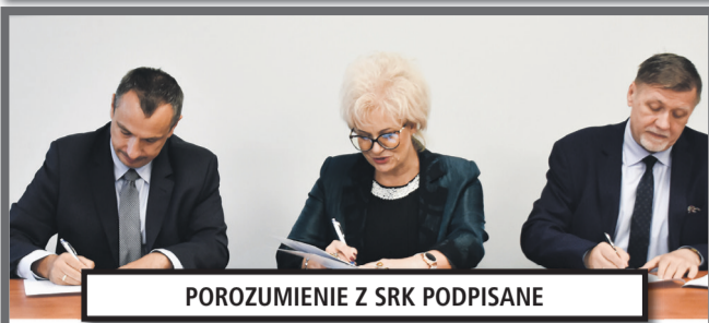
POROZUMIENIE Z SRK PODPISANE